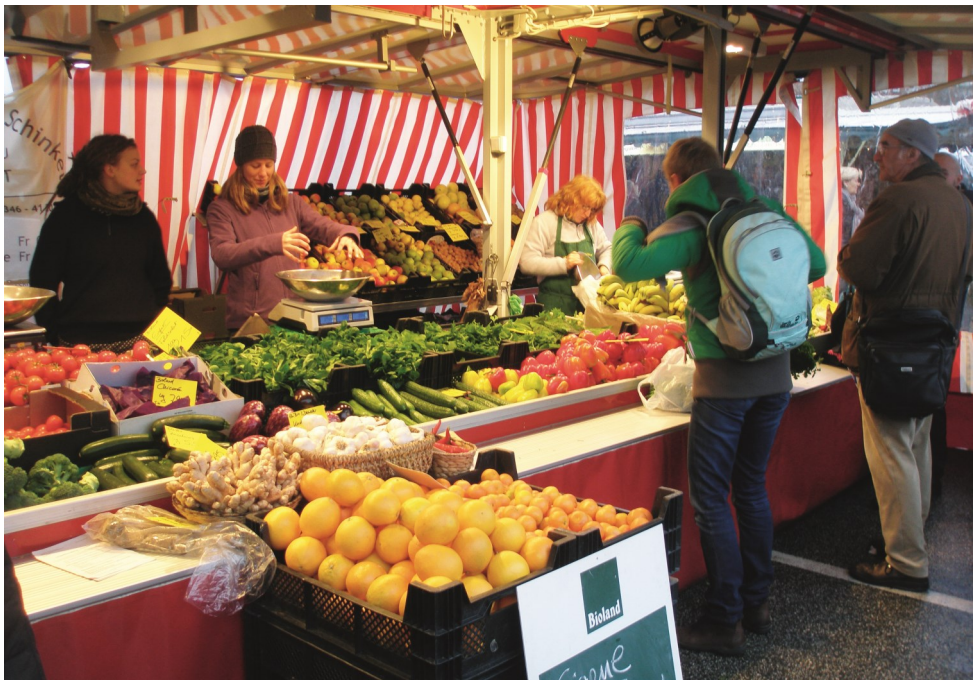
Der Wurzelhof ist auf den Wochenmärkten in Kiel (Exerzierplatz), Kronshagen und Gettorf mit einem breiten Sortiment vertreten.

Der Bioland-Verband hat sich vor wenigen Jahren diesen Vermarktungswegen und dieser Marketingphilosophie geöffnet und konterkariert damit sein eigenes Leitbild einer bäuerlichen und ökologischen Landwirtschaft. Die wesentlichen Inhalte einer nicht nur biologischen, sondern ökologischen Wirtschaftsweise könnten zu nur noch schönen Bildern verkommen, und der Bioland-Verband könnte seine Identität verlieren.